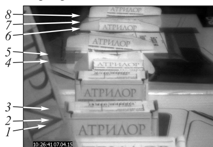
Рис. 3. Слияние на основе пирамиды контрастов и взвешенного суммирования дальностных кадров

Изображение, синтезированное с помощью разработанного комбинированного алгоритма, основанного на пирамиде контрастов (4)–(7), картосхемы дальностей (8), (9) и взвешенного суммирования кадров (10), приведено на рис. 3. Анализ показывает, что предложенный алгоритм слияния наиболее адекватен задаче формирования единого изображения из последовательности дальностных кадров, поскольку он в значительной степени обеспечивает подавление указанных выше артефактов.