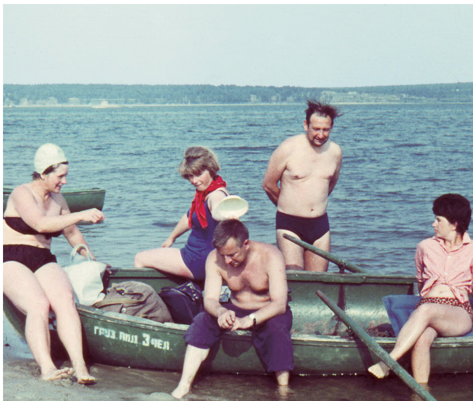
Та самая поездка на Обское море.