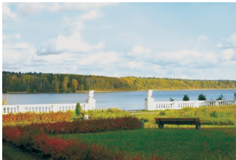
Вид на Череменецкое озеро.

Не обремененные огородами и хозяйством, озабоченные лишь присмотром за детьми и приготовлением на керосинке нехитрого обеда, наши семьи, почти как дореволюционные дачники