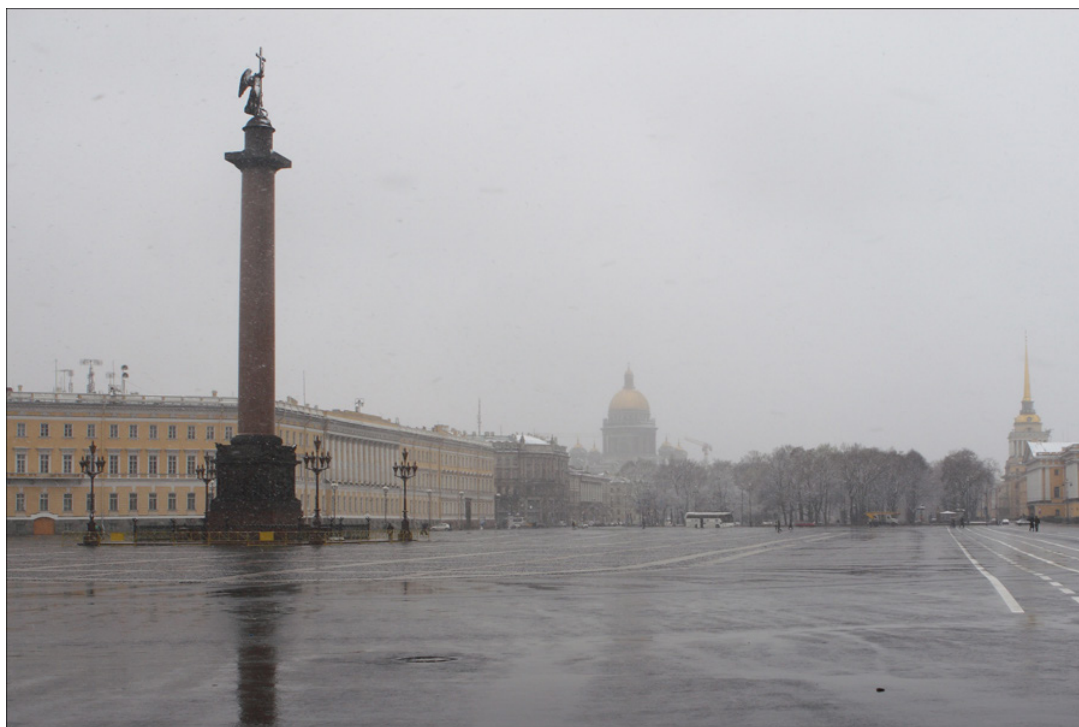
Ленинград, дворцовая площадь.