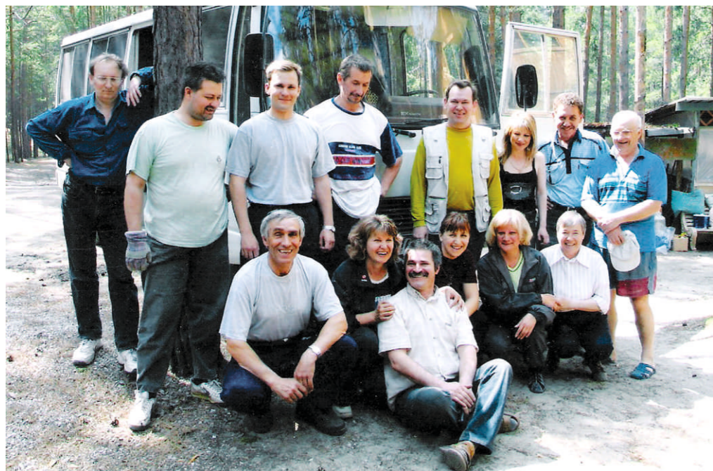
Профком ИАиЭ СО РАН на базе отдыха ИАиЭ СО РАН.