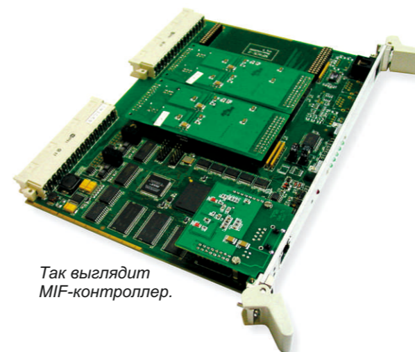
Так выглядит MIF-контроллер.

Бердский электромеханический завод, Новосибирский жировой комбинат, Управление пассажирских перевозок Мэрии г. Новосибирска, Приобские электросети» ОАО ЭиЭ "Новосибирскэнерго".