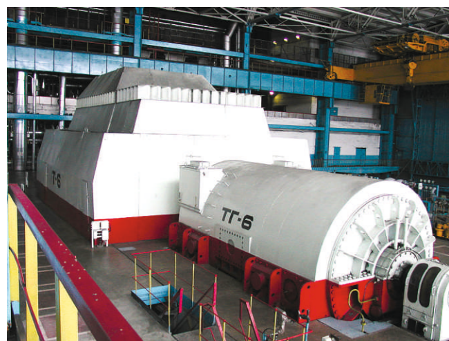
Турбина и генератор шестого энергоблока Новосибирской ТЭЦ-5. Котел на фотографии не помещается его высота "всего лишь" 60 м.