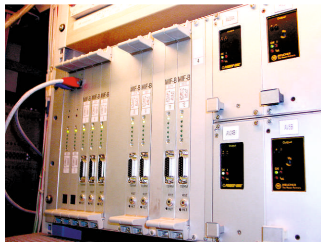
MIF-контроллеры в крейте. Это только малая часть системы.