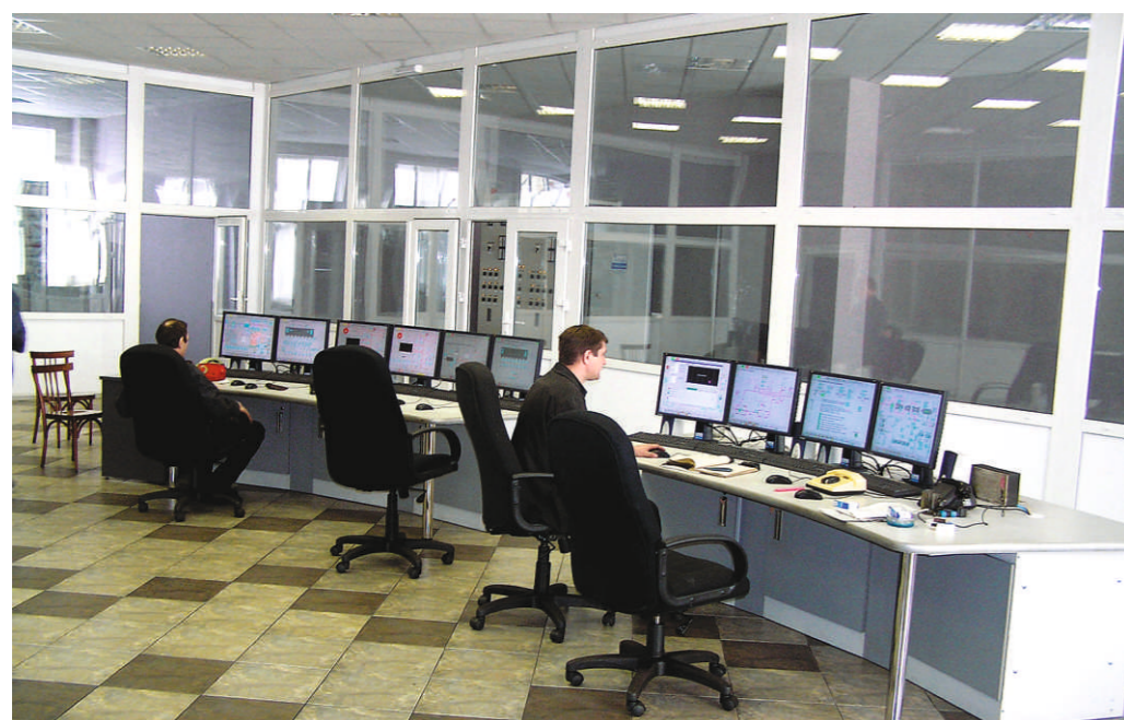
Групповой щит управления ООО "Бийскэнерго" после реконструкции.

- о науке (если такое вообще возможно в инженерном деле). В ИЦ-6 впервые в массовом порядке, группами, хлынули студенты, конкурирующие за право сделать в инженерном центре диплом и "приобщиться к делу автоматизации в области энергетики". А ведь раньше студенты "просачивались" сюда поодиночке, а о конкурсном отборе и речи быть не могло! Похоже, среди студенческой братии престиж ИЦ-6 растет.