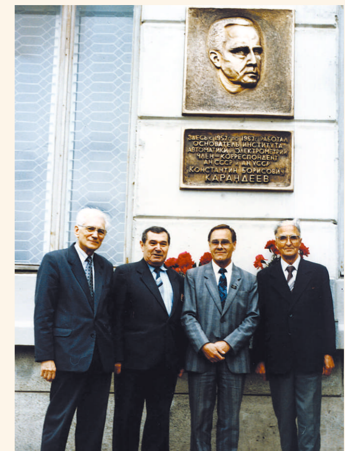
Открытие мемориальной доски первому директору Института К.Б. Карандееву.

Создана оригинальная алгоритмическая база обработки данных в реальном времени в приложении к одной из важнейших современных задач - обнаружению малоразмерных подвижных слабоконтрастных изображений, получаемых с космических носителей. Изучена