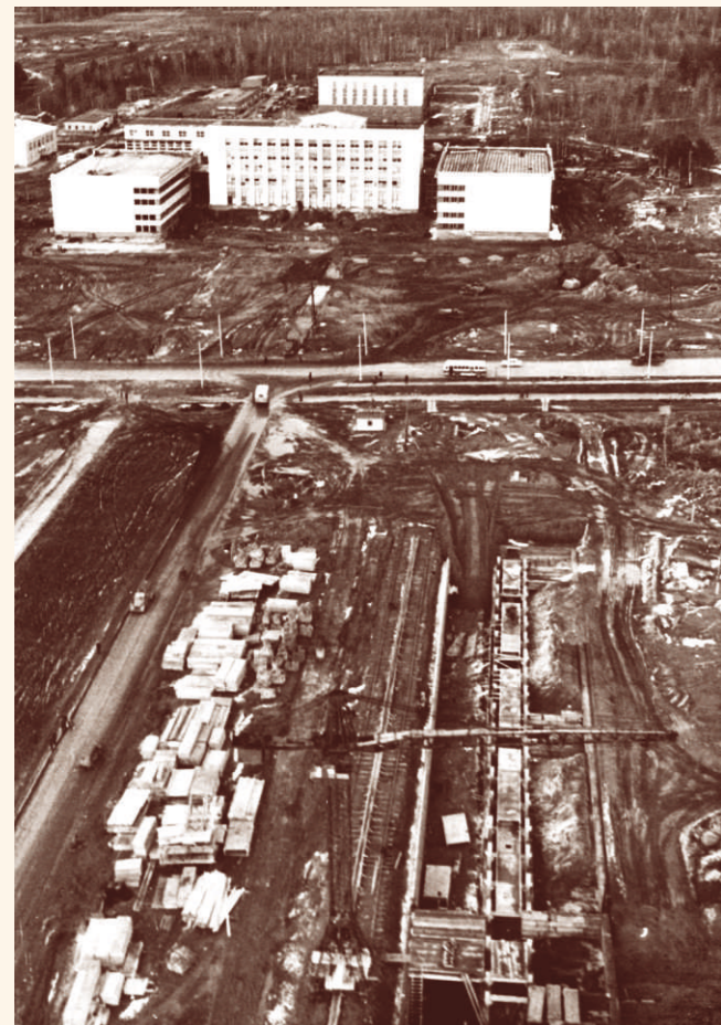
Строительство Института началось.