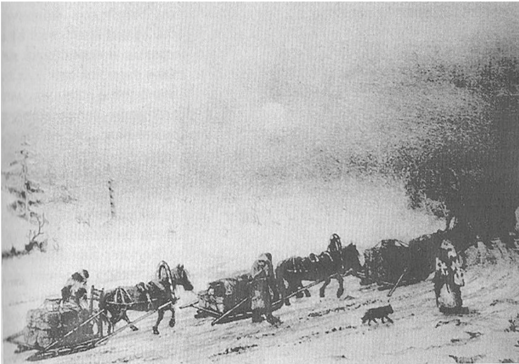
Обозы по чайному тракту, Томск, 1890 г.