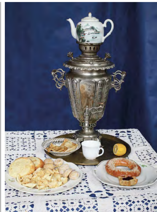
Традиционные сибирские угощения к чаю – калачи, шаньги, стружи, тарки и прочее

Старообрядцы же, несмотря на бытовавшую в XIX – начале XX в. моду, осуждали потребление покупного китайского чая, что нашло отражение в народных поговорках, например: «Чай проклят на трех соборах, а кофе на семи», «Кто пьет чай, тот спасения не чай». Они предпочитали следовать старым русским традициям и пили травяные отвары или заварки в виде смородишника, малинника, иван-чая, из сборов калинового, черемухового цвета и прочих растений. В отличие от старообрядцев Центральной России и Поволжья, примирившихся с чаепитием, многие сибирские сторонники староверия не употребляли чай и в начале XXI века. В разного рода духовных поучениях, Цветниках интерпретируются запреты, принятые в старообрядческой среде. В главе о запрете на употребление