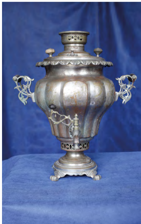
Самовар типа «чашка ложчатая», Новосибирская область, конец XIX в.