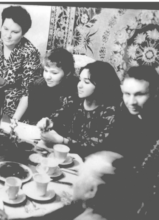
Гадание за самоваром под старый Новый год, село Маслянино Новосибирской области, 1990 г.