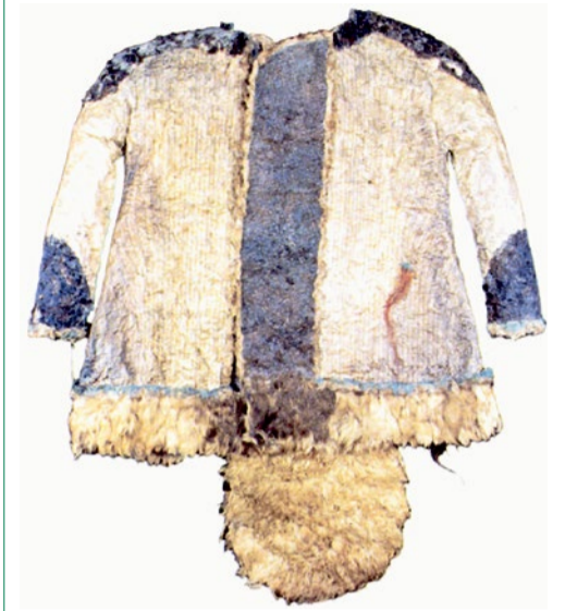
Верх-Кальдзин, шуба. Раскопки В.И. Молодина

запад непосредственно в первом тысячелетии до нашей эры.