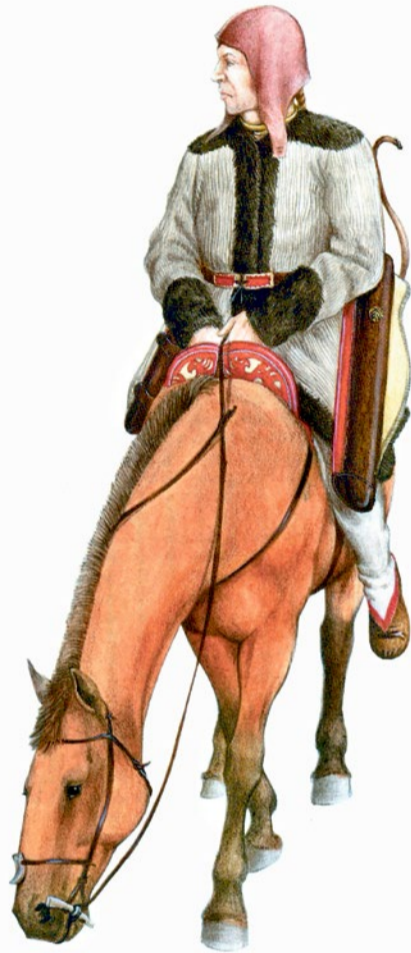
Всадник на коне. Реконструкция костюма по материалам мужских погребений Уюка. Автор Д.В. Поздняков

пока что отстает. Но у нас есть преимущество — замечательный материал, накопленный и систематизированный археологами и антропологами за многие десятилетия. Они уже поделили его на группы, определили, когда они существовали, какие у них могли быть культурные и прочие связи. Теперь мы вместе на основании известных данных тестируем гипотезы по происхождению той или иной этнической группы с точки зрения генетики. Все эти исследования нужны для того, чтобы реконструкции стали более объективными.