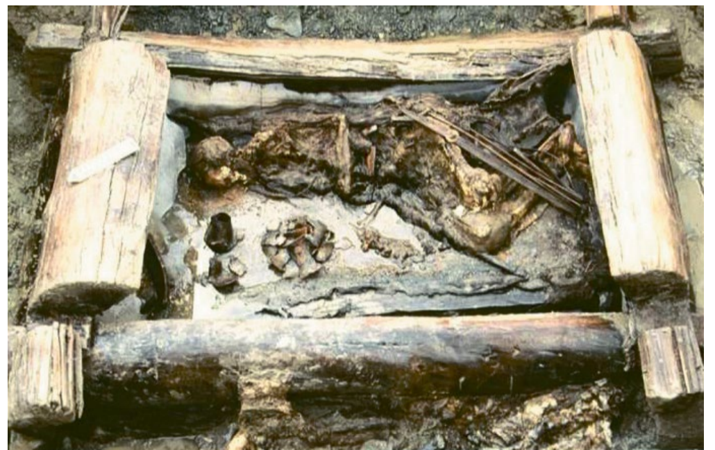
Верх-Кальдзин, погребальный комплекс пазырыкской культуры. Раскопки В.И. Молодина

— К классическим скифам из Северного Кавказа и Причерноморья оказались близки народы, и сейчас проживающие преимущественно в этих регионах, а к восточным кочевникам — современные группы тюркоязычного населения. Эти данные были неверно истолкованы некоторыми СМИ, выпустившими сообщения о якобы «прямой предковой связи между ски-