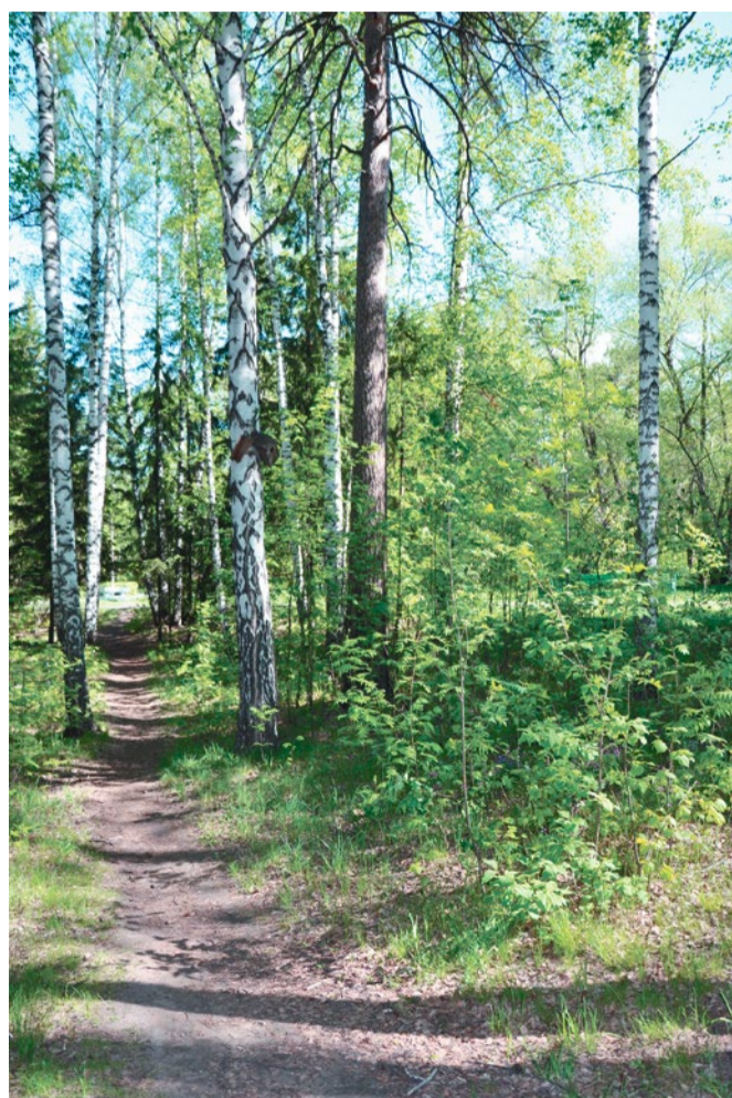
Тропинка в лесу у Дома ученых СО РАН в Академгородке

Наталья Бобренок