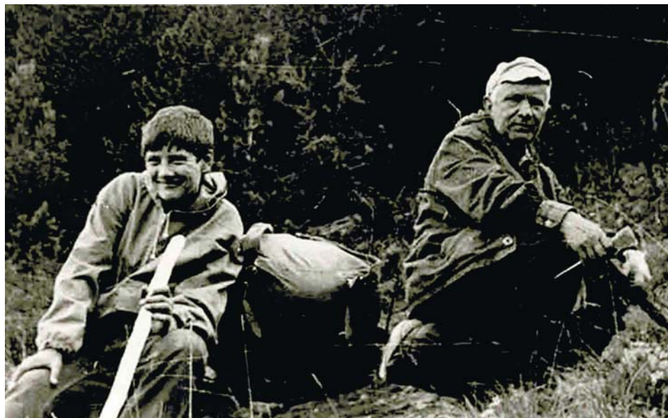
В походе. 1980-е годы

Записала Диана Хомякова Фото предоставлены О.И. Лаврик и из архива СО РАН