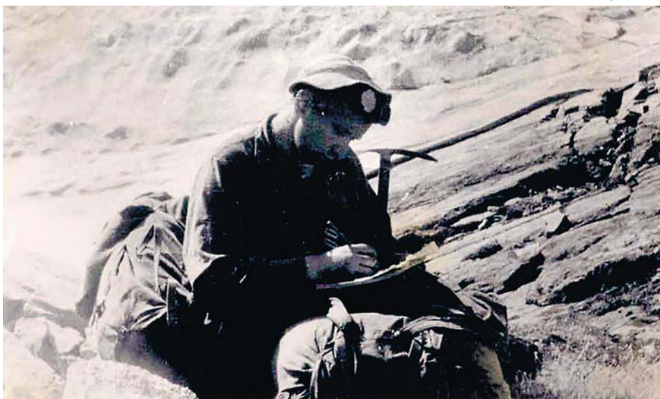
Туризм — лучший способ отдохнуть и обдумать сделанное!