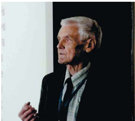
Выступление с докладом на XI Всероссийском съезде по механике 21 августа 2015 года в Казани