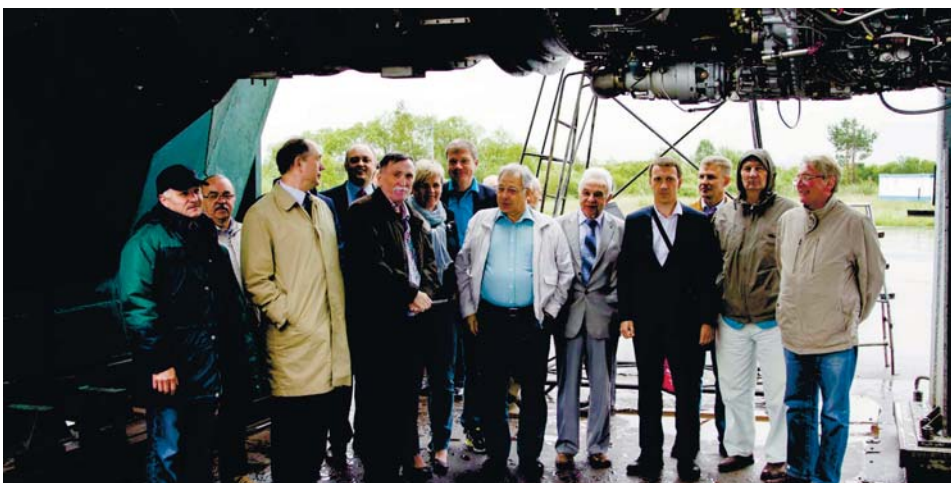
Открытый натурный испытательный стенд АО «Авиадвигатель». Осмотр двигателя

Другой актуальной проблемой для совершенствования гражданских самолетов является уровень акустического шума двигателей, особенно на режимах набора высоты и посадки. Российские самолеты всегда отличались качественной аэродинамикой, но отечественные авиационные двигатели существенно уступали иностранным аналогам по уровню шума.